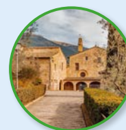
9 Santuario di San Damiano