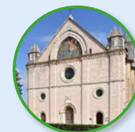
10 Santuario di Rivotorto