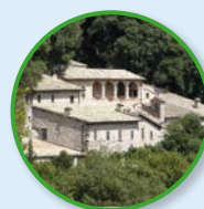
8 Eremo delle Carceri