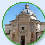
7 Chiesa Nuova